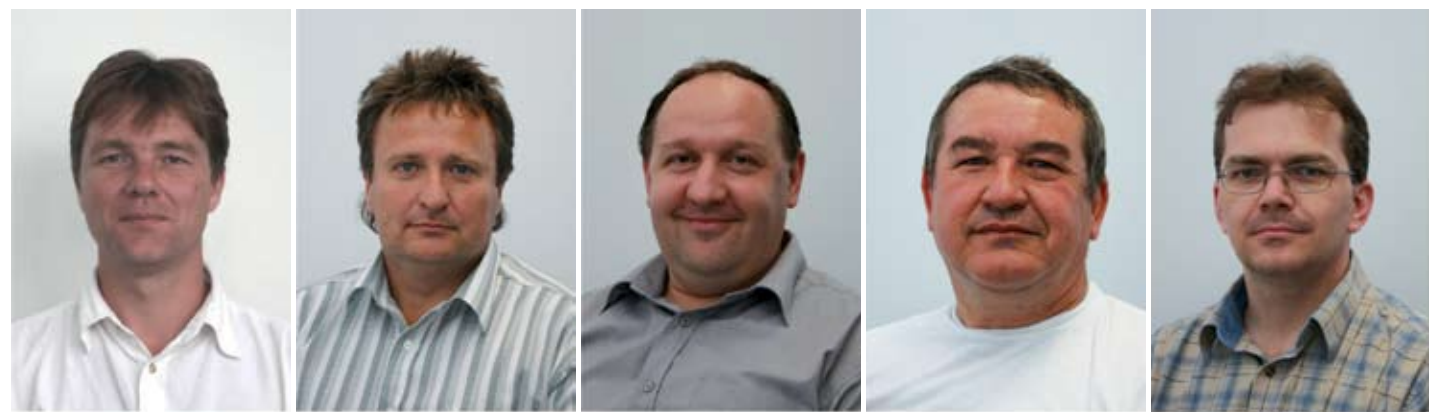
Balázs Attila Energetikai Iroda