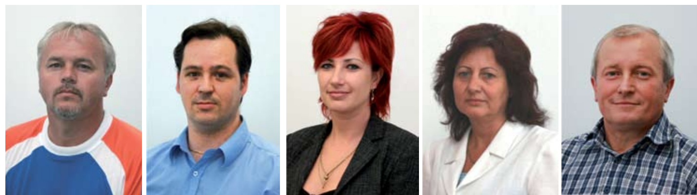
Hanzel Árpád Közúti Szállítási Egység