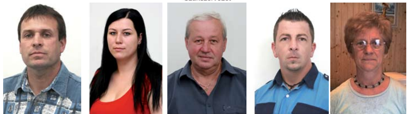
Lőrincz János Vasúti Szállítási Egység