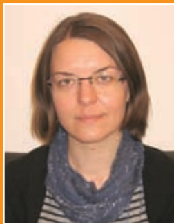
A szakmai anyagot készítette: Dr. Schnider Marianna, jogász