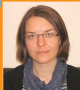
A szakmai anyagot készítette: Dr. Schneider Mariann, munkajogász