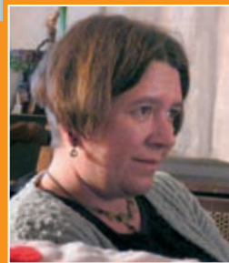
Összeállította: Óriné dr. Gracza Zsuzsanna, munkajogász

Több feláras gyors- és sebesvonalat közlekedtet május 15-e óta a MÁV-START Zrt. – derült ki a közösségi közlekedési rendszer korszerűsítésével összefüggésben meghirdetett menetrendből. E vonatok használatához a MÁV-START Zrt. rugalmasan felhasználható, a jelenleg ismert IC- pót- és helyjegynél olcsóbb, új gyorsvonati pótjegy elnevezésű felárat vezet be.